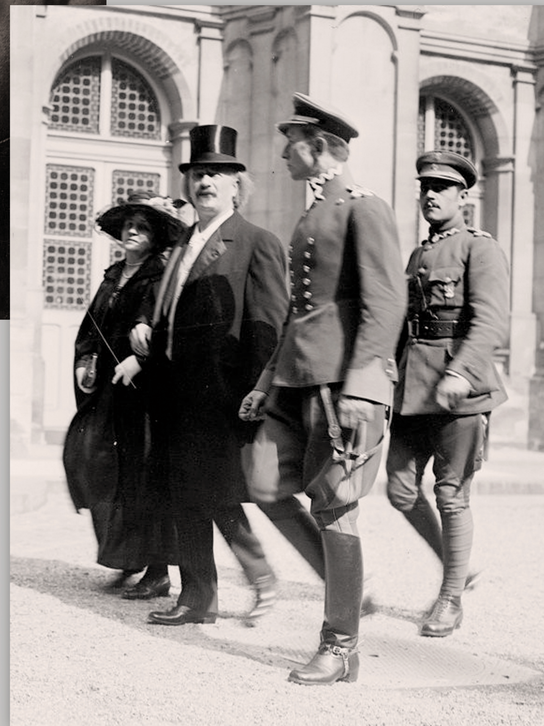
Ignacy Paderewski z żoną