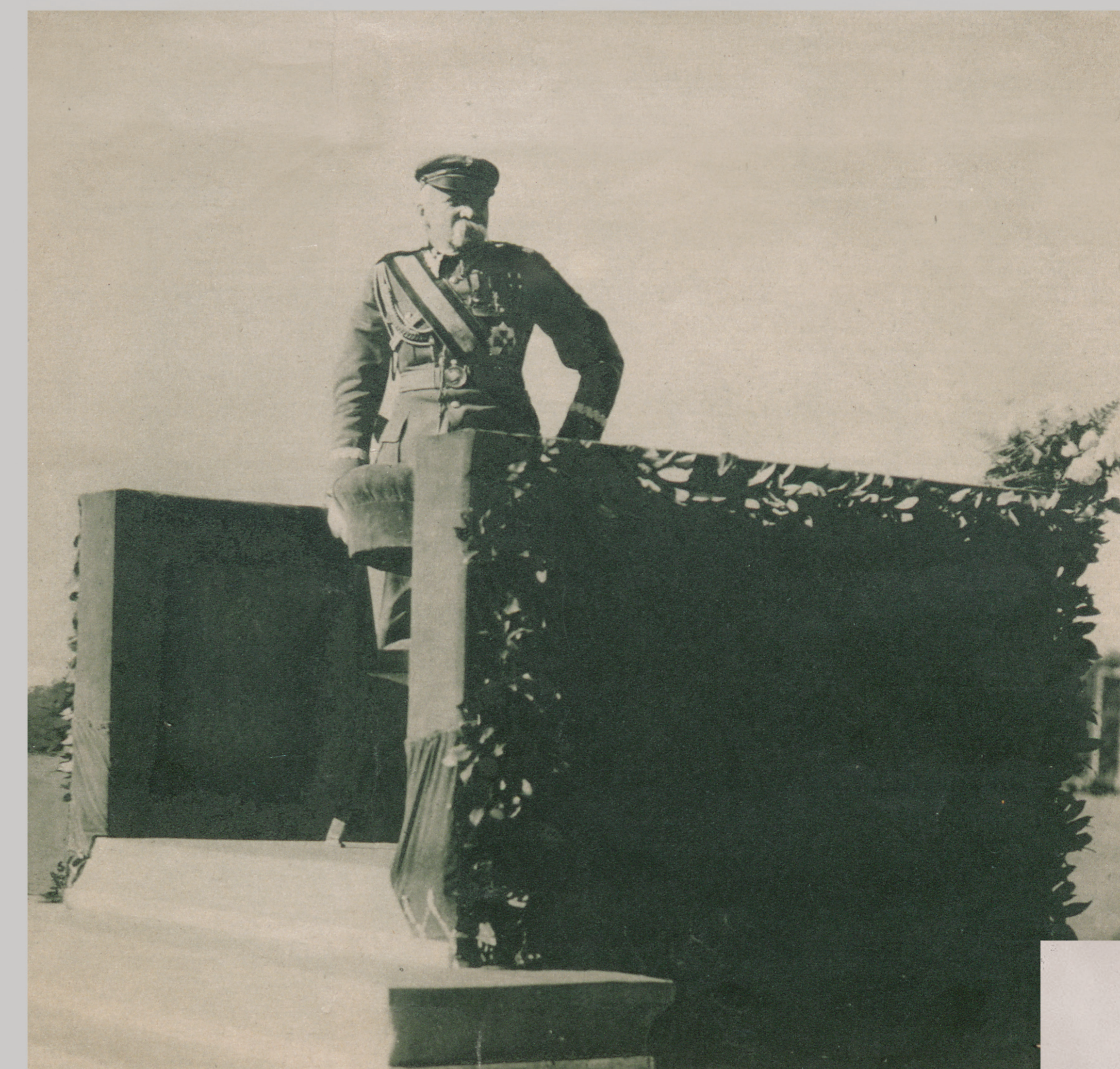
Marszałek Józef Piłsudski

20 października 1921 r. Rada Ambasadorów akceptuje decyzję rady Ligi Narodów w sprawie podziału Śląska.