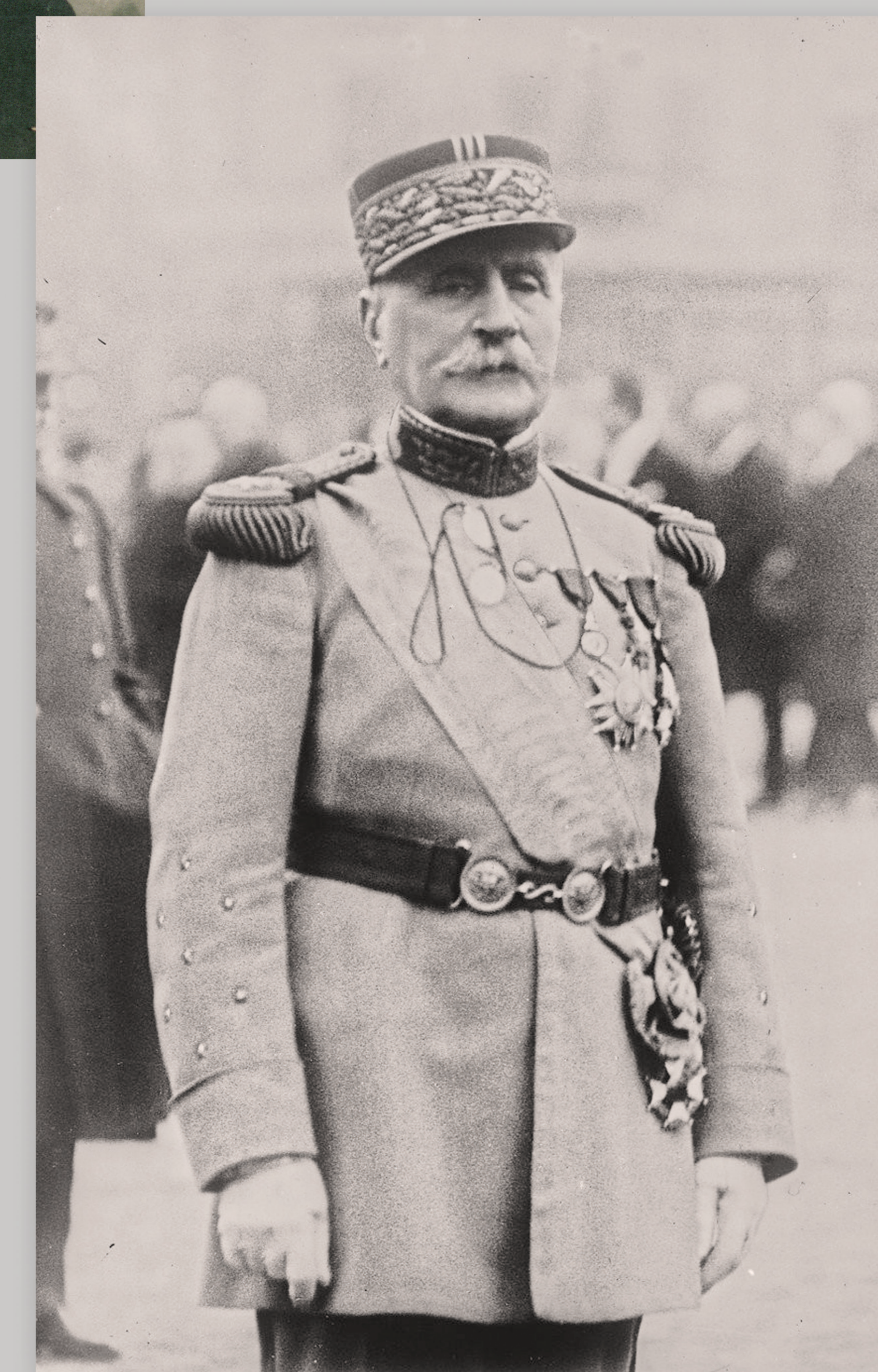
Marszałek Ferdinand Foch