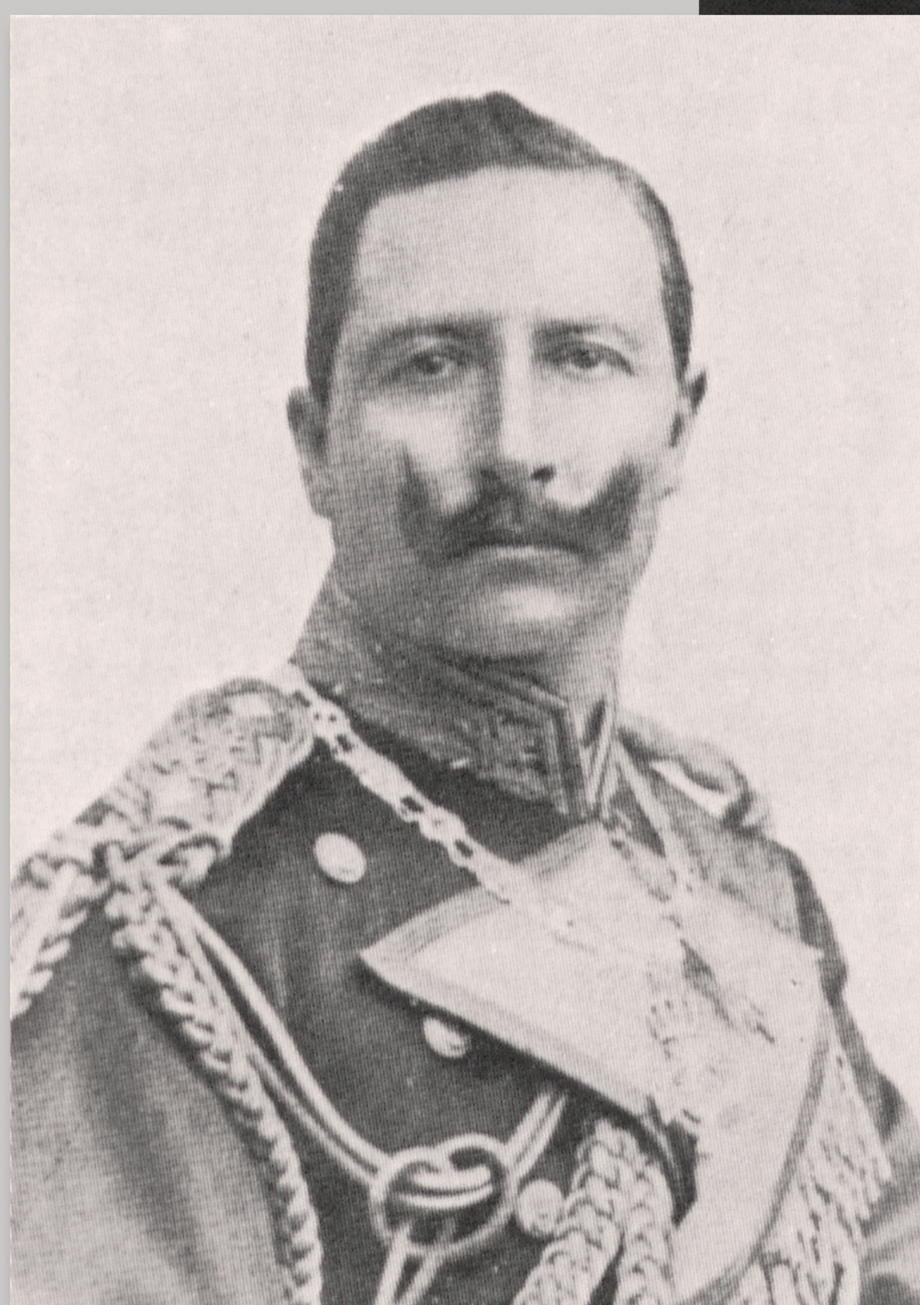
Cesarz Niemiec Wilhelm I