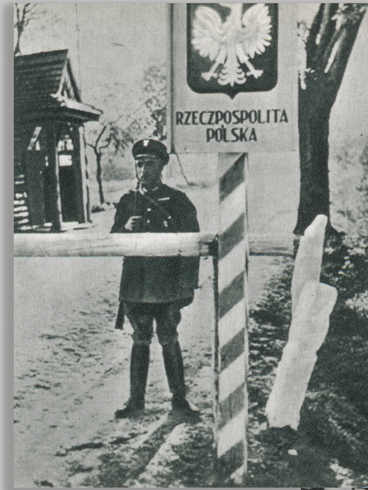
Posterunek Straży Granicznej i Celnej na drodze Katowice-Gliwice