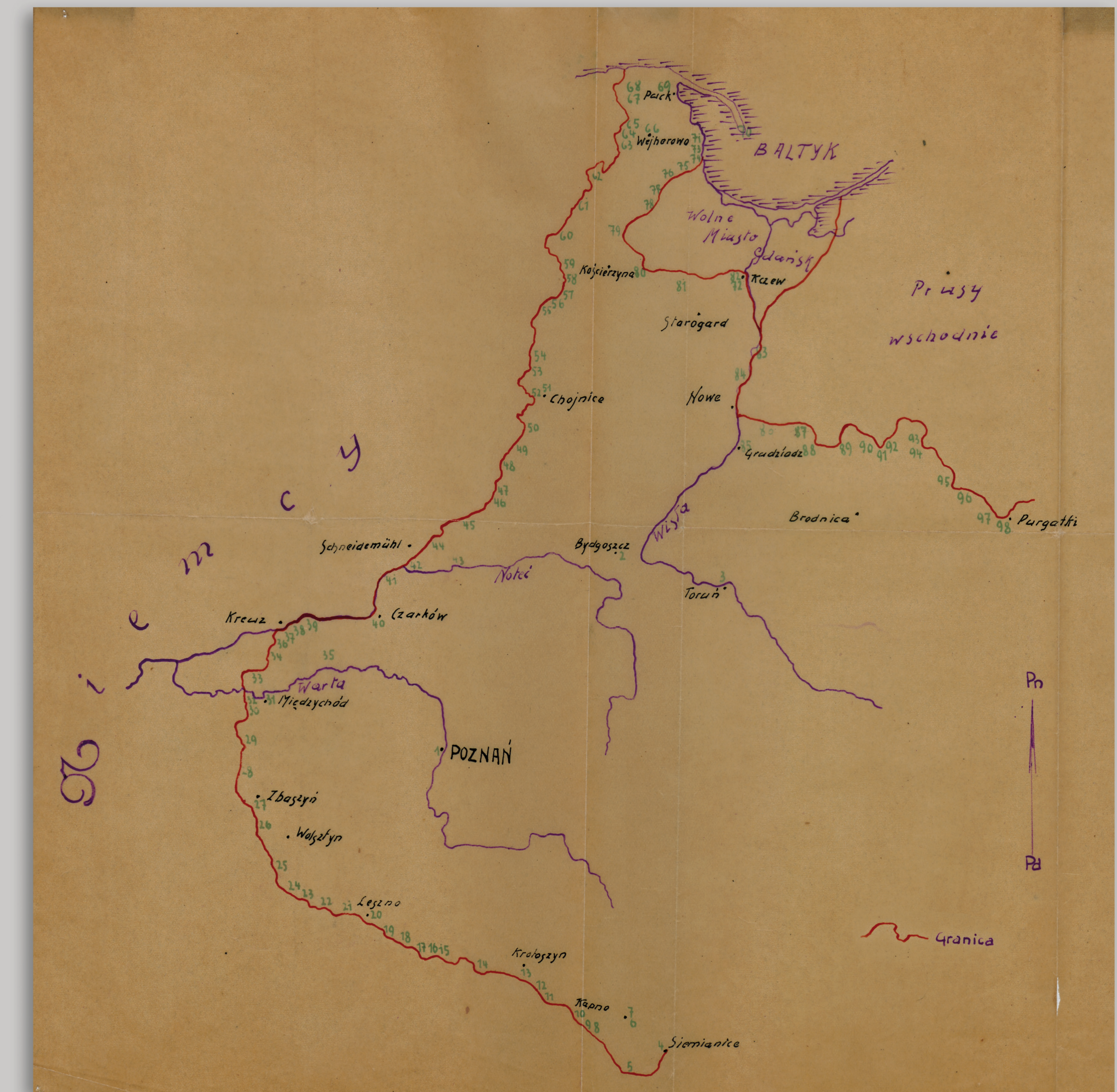
Rozmieszczenie i spis polskich placówek celnych

Polsko-niemiecka granica w Rudzkiej Kuźnicy (Rudahammer), dzisiaj część Rudy Śląskiej, widziana od strony niemieckiej.