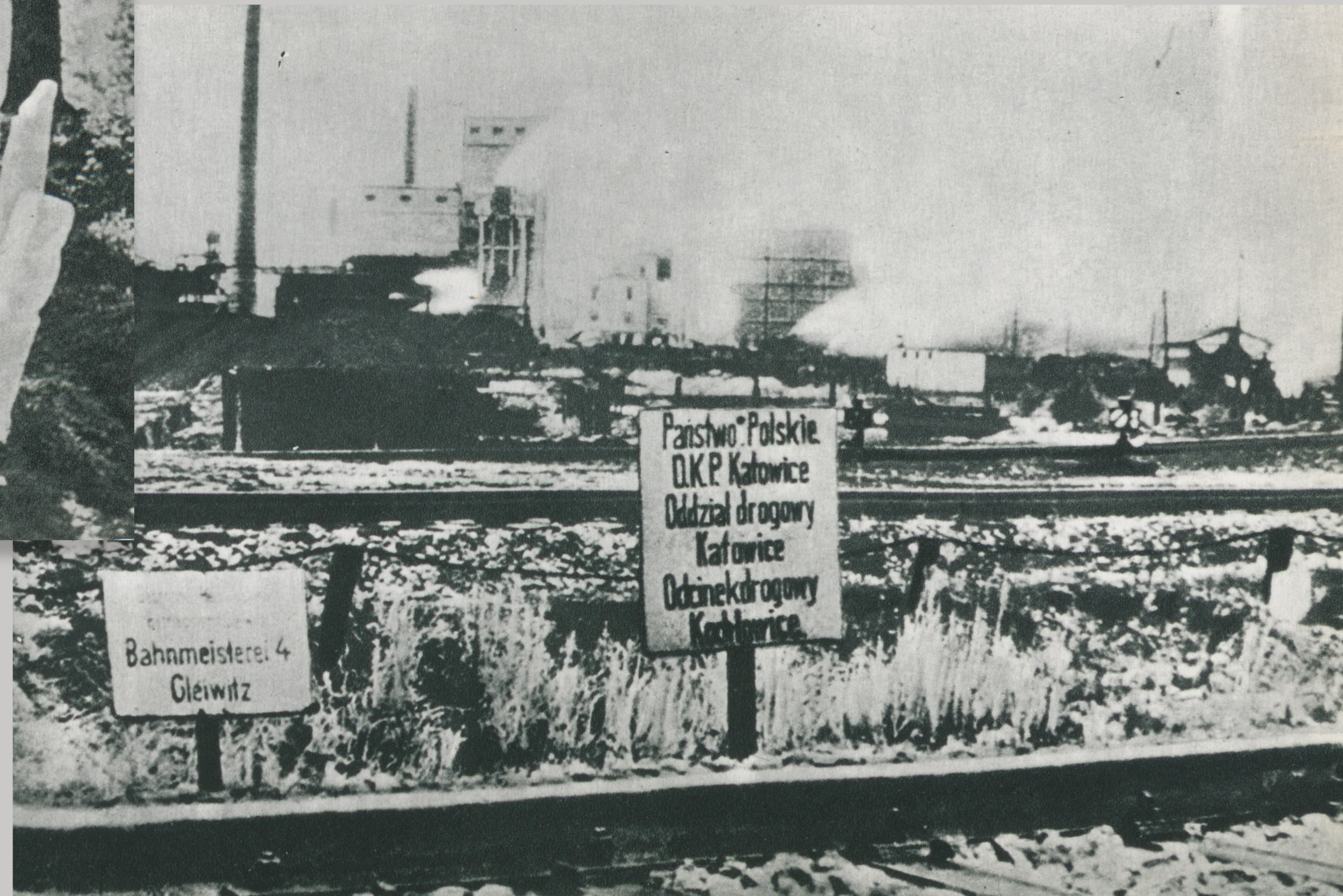
AP Wr., Zbiory biblioteczne