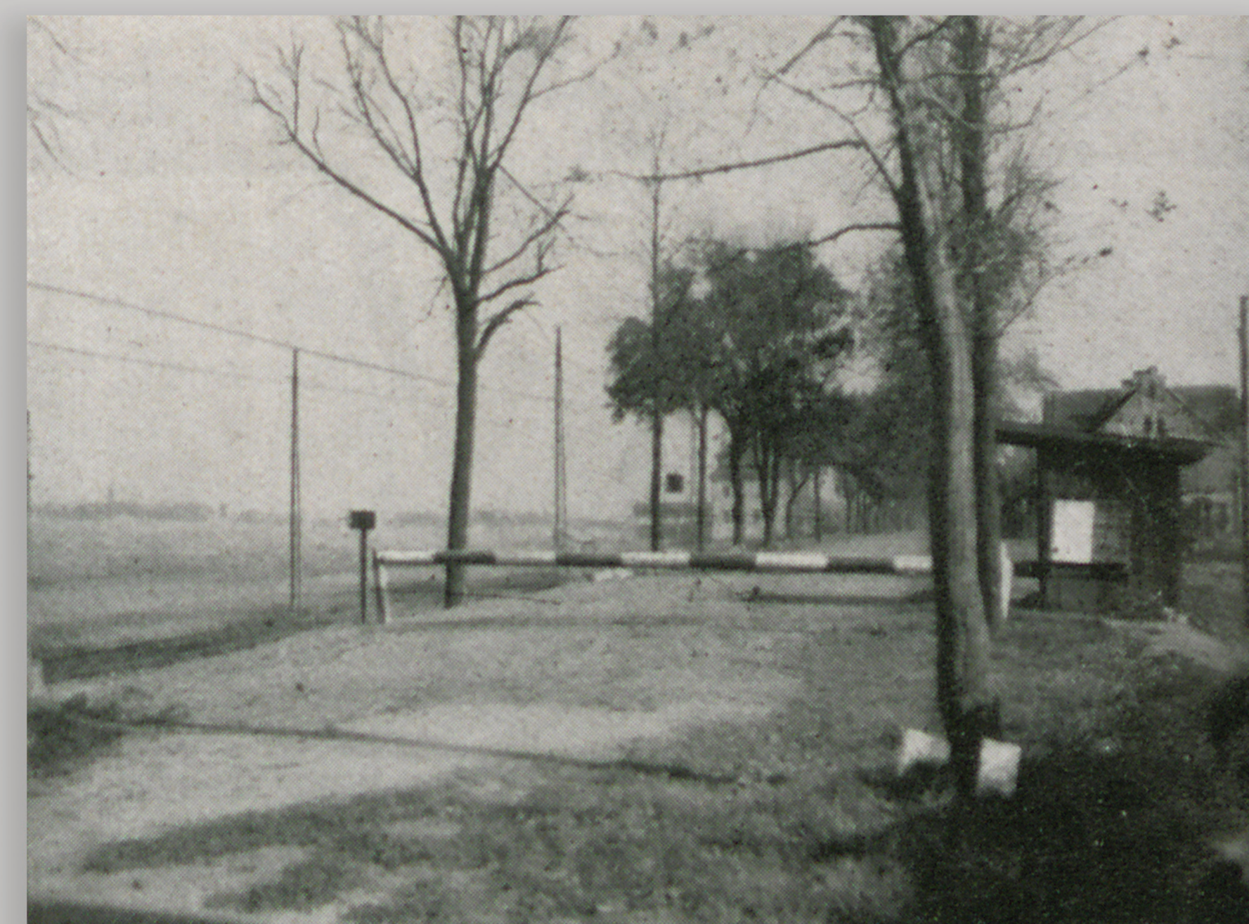
APWr., Urząd Skarbowy Prowincji Śląskiej, sygn. 856, s.23

Przejście Graniczne i Celne w okolicy Zabrze (dawniej Hindenburg). Gdy 9 czerwca 1923 r. Międzysojusznicza Komisja Graniczna przyznała Niemcom kopalnię „Delbrück”, po polskiej stronie pozostał fragment linii kolejowej z dworcem w Makoszowej, piaskownia obsługująca kopalnię oraz część kopalnianych domów mieszkalnych. Przez wybudowane wówczas przejście graniczne przechodzili górnicy z Makoszowa do pracy w kopalni.